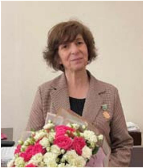
Аибашьфы – арцафы